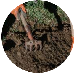
Elección de terreno