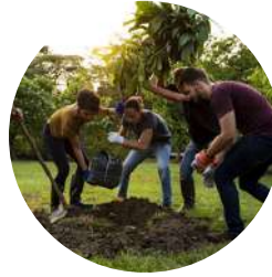
Elección del acto, urna