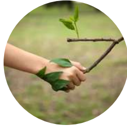
Elección de árbol